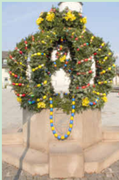
Osterbrunnen auf dem Marktplatz in Konradsreuth

Wir wünschen allen Bürgerinnen und Bürgern ein schönes und erholsames Osterfest!