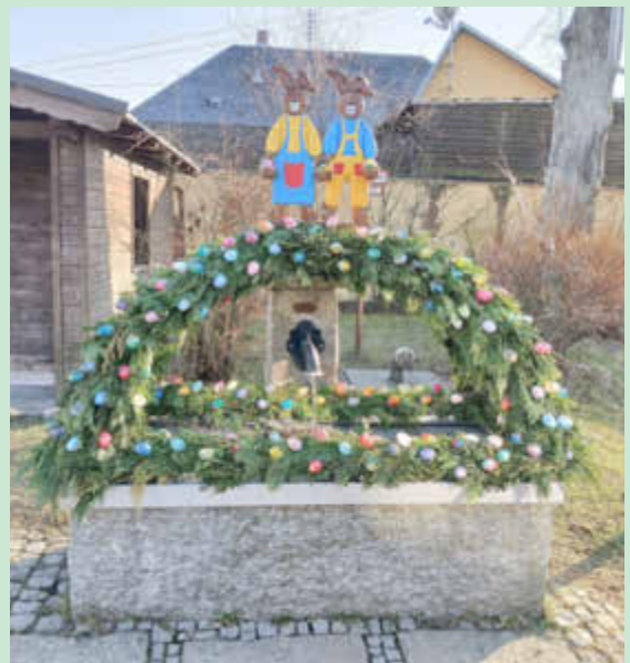
Osterbrunnen in Ahornberg