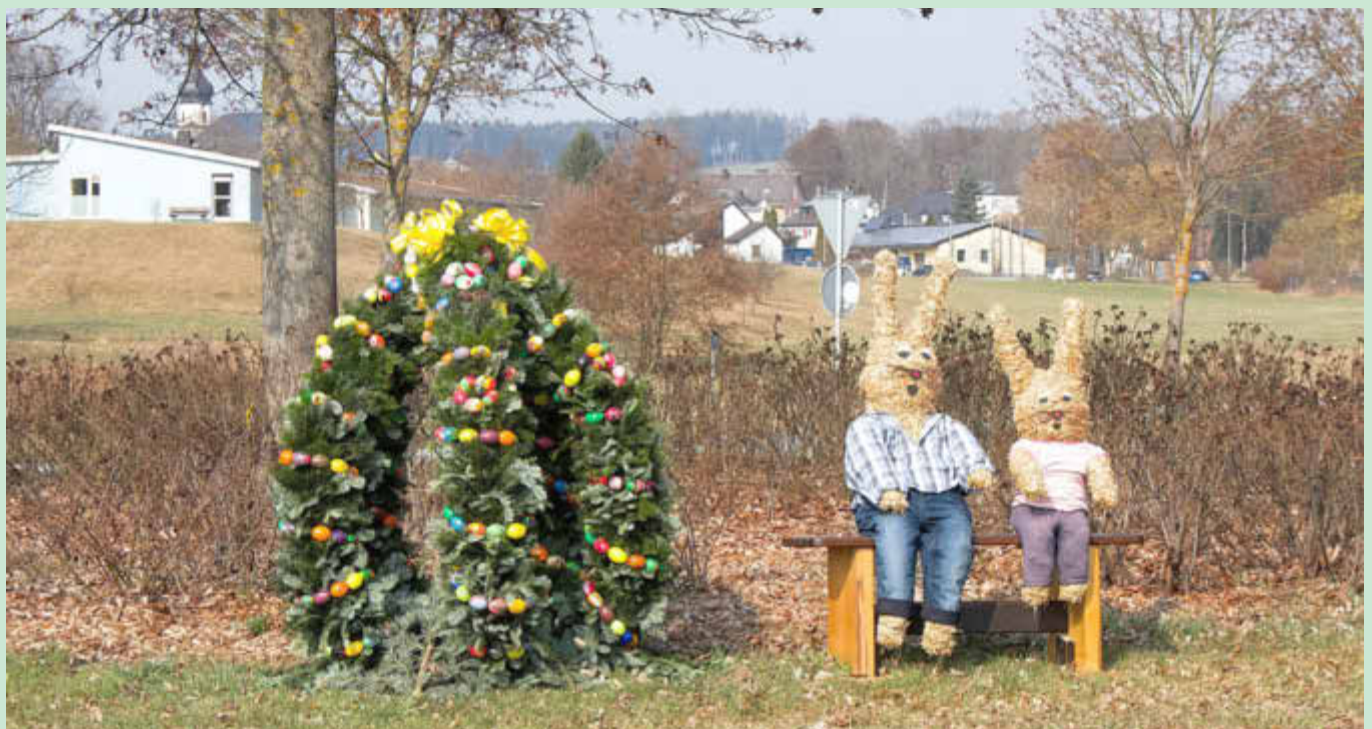
Osterei mit Hasen auf dem äußeren Kreisel in Konradsreuth